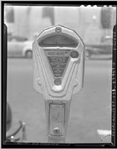
Le premier parcomètre, installé en 1935 à Oklahoma City

Le diagnostic de stationnement de l'agglomération nous apprend que plus de 90% des places dans les arrondissements sont non tarifées, que les places avec parcomètre représentent 5% de l'offre totale de stationnement sur rue tandis que les vignettes résidentielles représentent environ 4% des espaces.